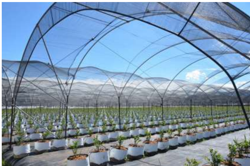
Малообъемное выращивание голубики (защищенный грунт)